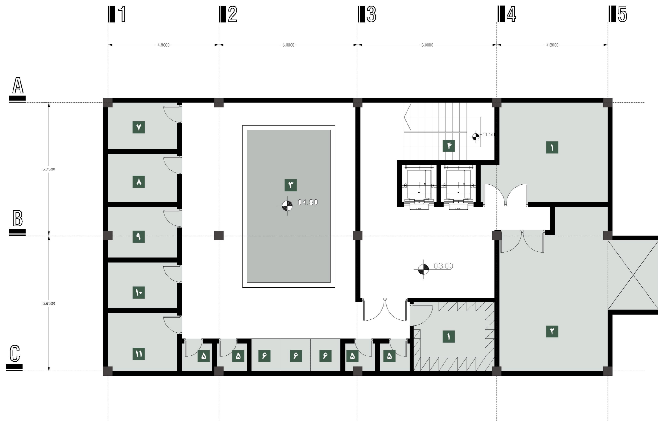
پلان ساختمان مشاعات