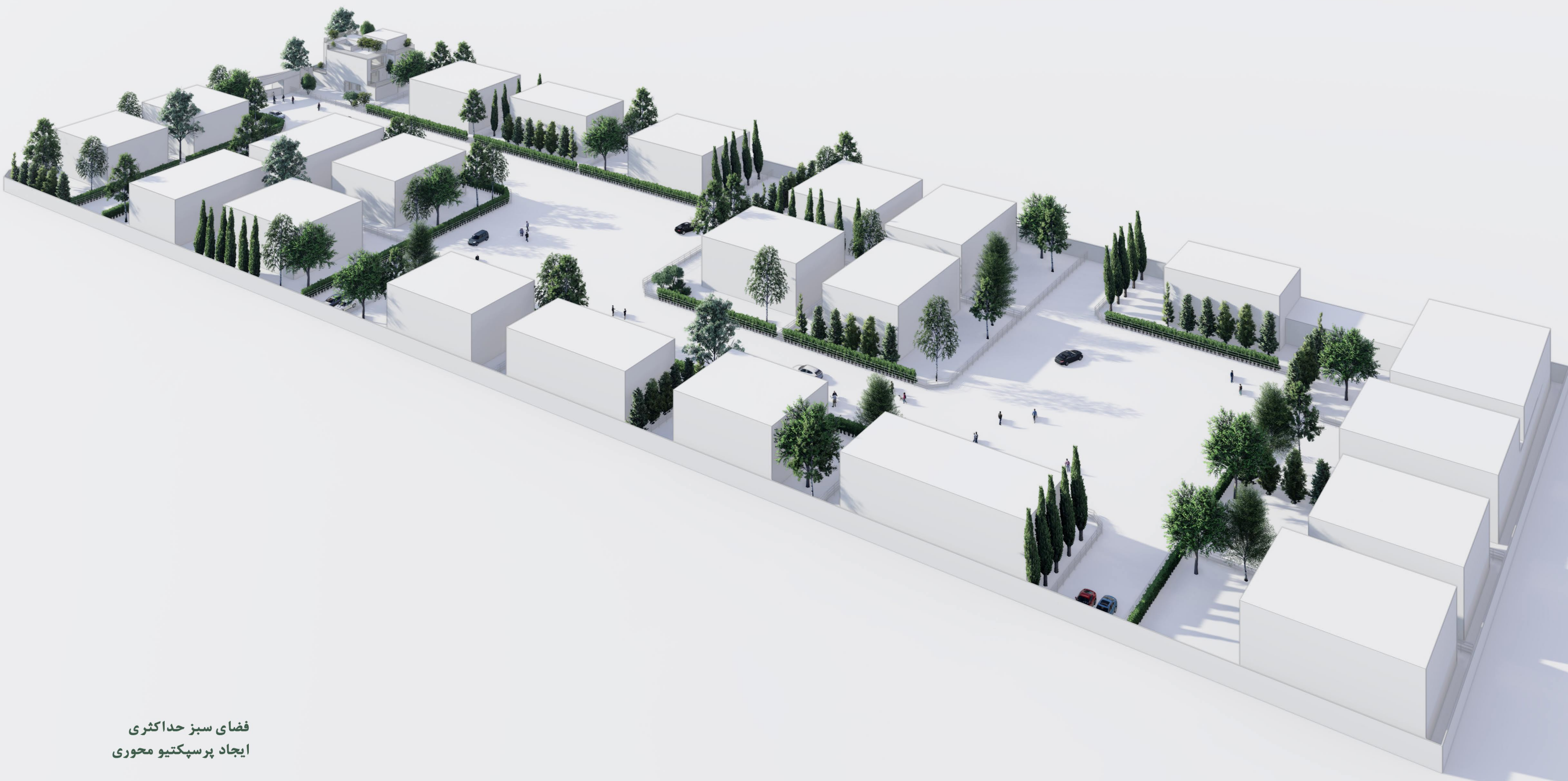
فضای سبز حداکثری ایجاد پرسپکتیو محوری