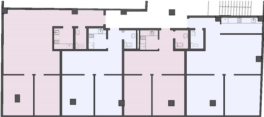
CURRENT PLAN SOUTHERN SIDE

CHANGING THE ARRANGEMENT OF ROOMS | ADDING TERRACE NEXT TO THE COLUMNS