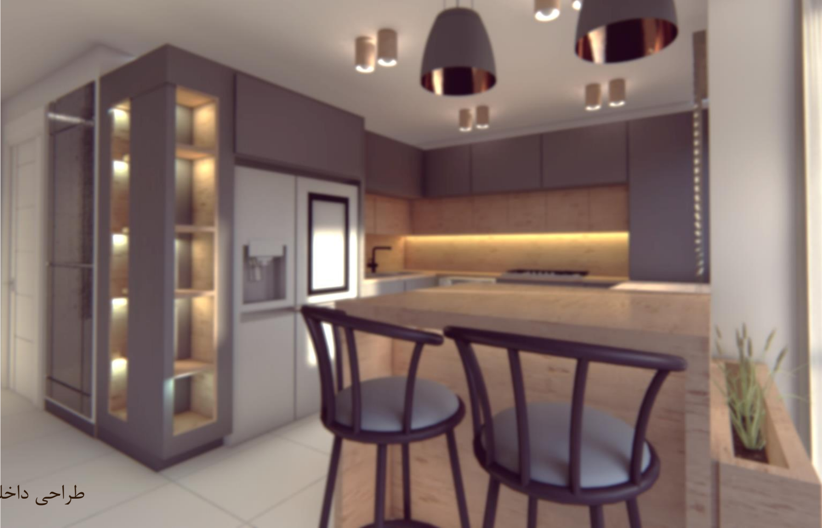
طراحی داخلی آشپزخانه