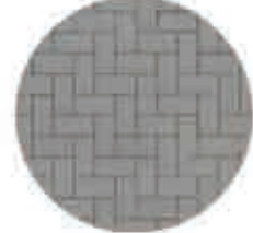
کفپوش بتنی به رنگ خاکستری