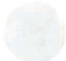
محل نشستن از جنس بتن

استفاده از مصالح سخت و سنگین در کف یاده راه و مسیر تردد خودرو