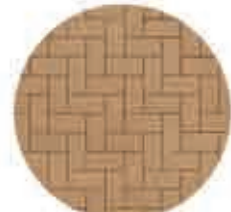
کفپوش بتنی متناسب با رنگ نما