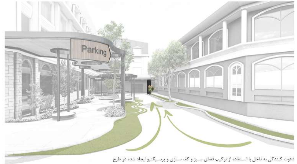
دعوت کنندگی به داخل با استفاده از ترکیب فضای سبز و کف سازی و پرسپکتیو ایجاد شده در طرح

استفاده از یک گیاه شاخص رنگی همراه با چیدمان ستون ها به گونه ای که حس دعوت کنندگی به ورودی بازار بدهد.