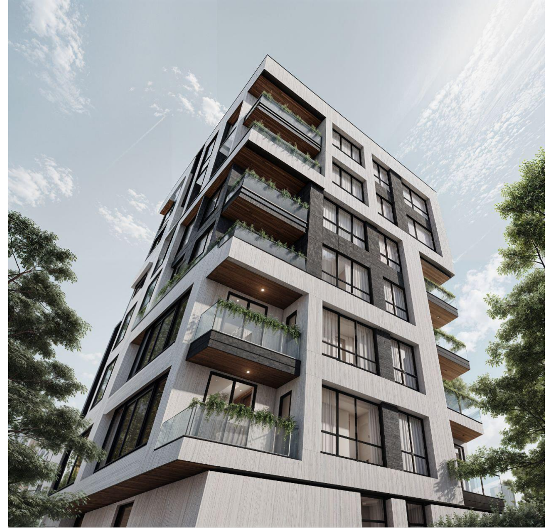
راست : غرب چپ: شمال