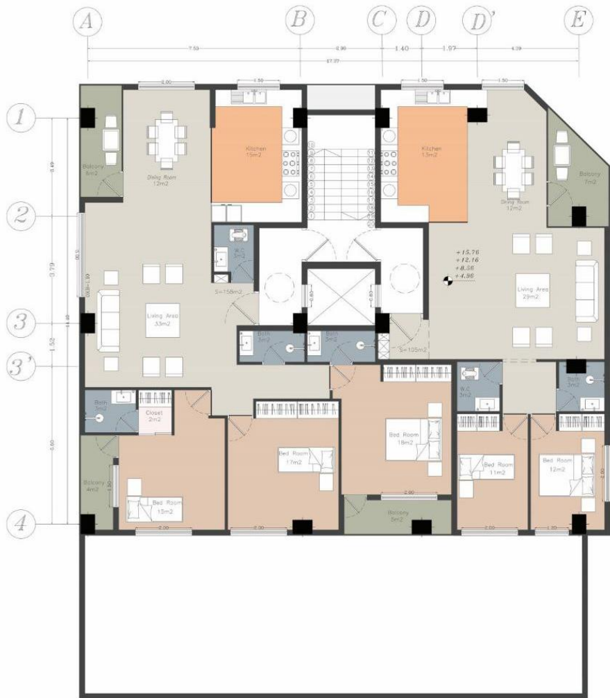
پلان دو واحدی