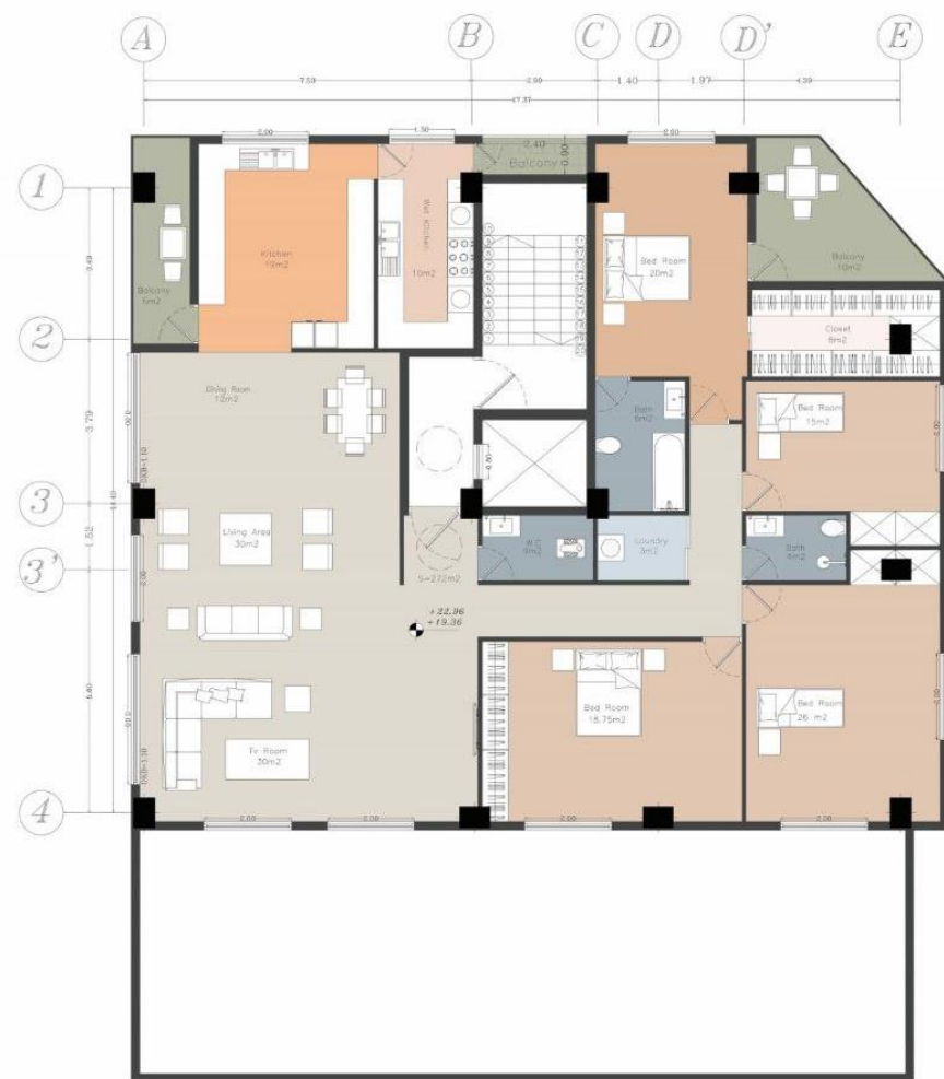
پلان تک واحدی