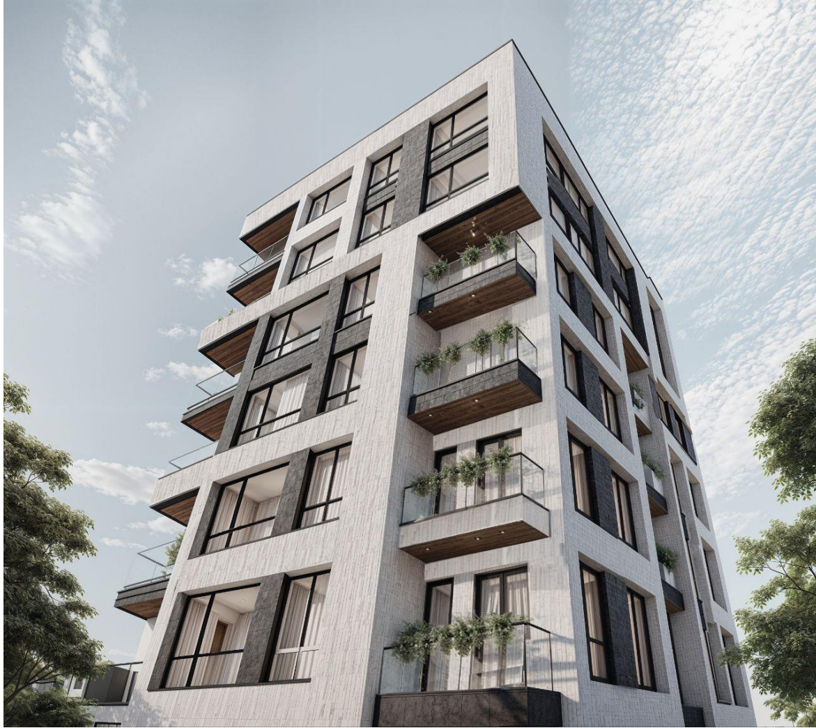
راست : جنوب چپ: غرب