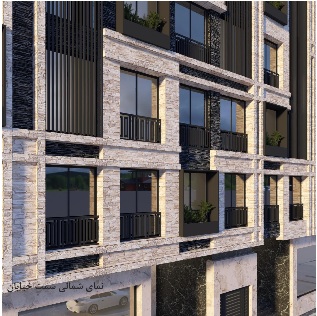
نمای شمالی سمت حیابان