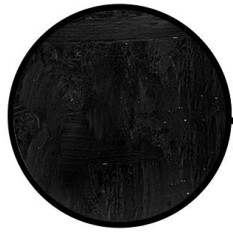
فلاشینگ گالوانیزه سیاه