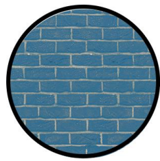
آجر قزاق لعابدان فیروزه ای