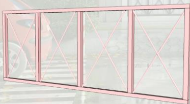
جزئیات زرده‌های فلزی مشکی تراس