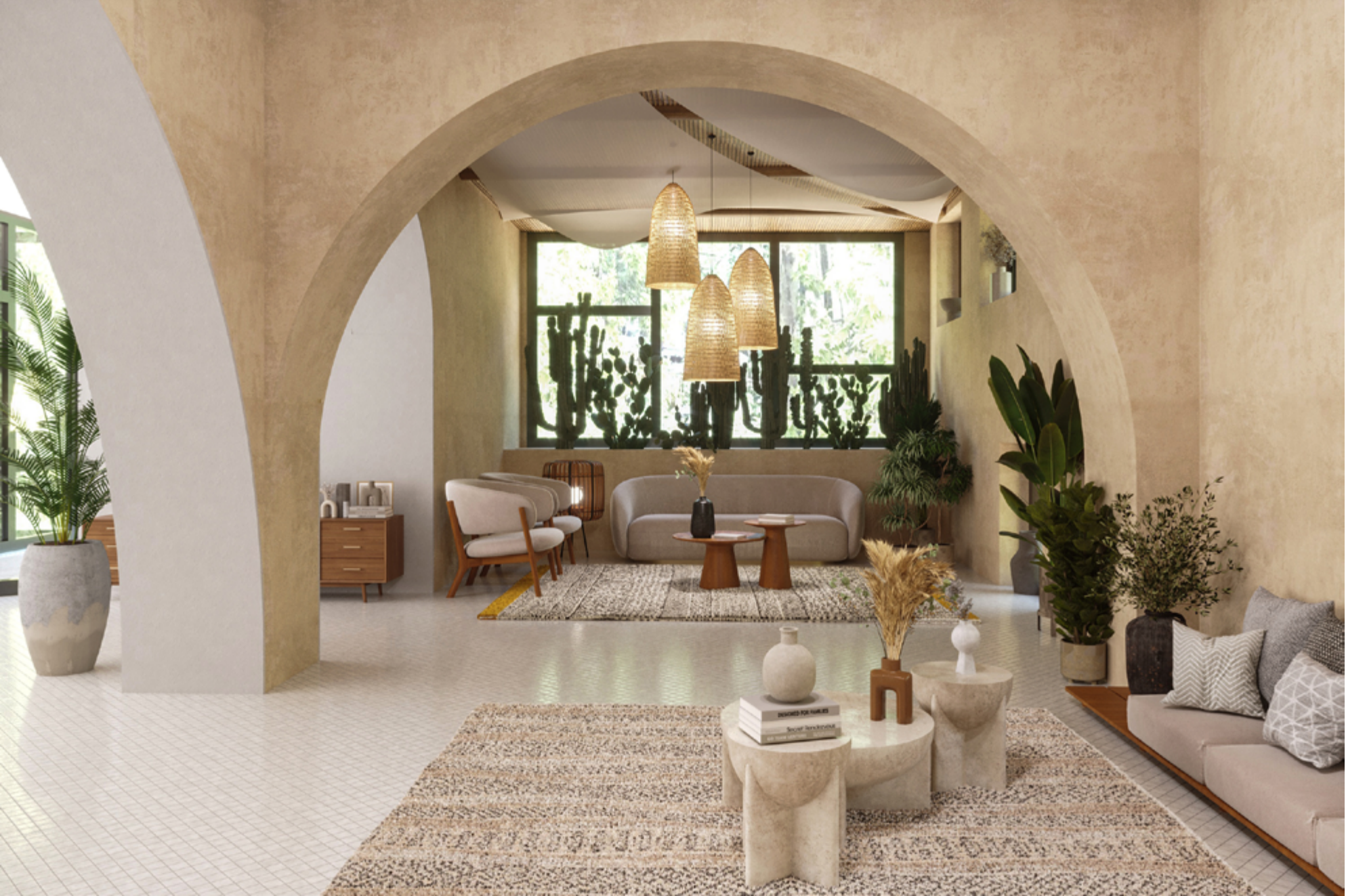
بخش جنوب غربی