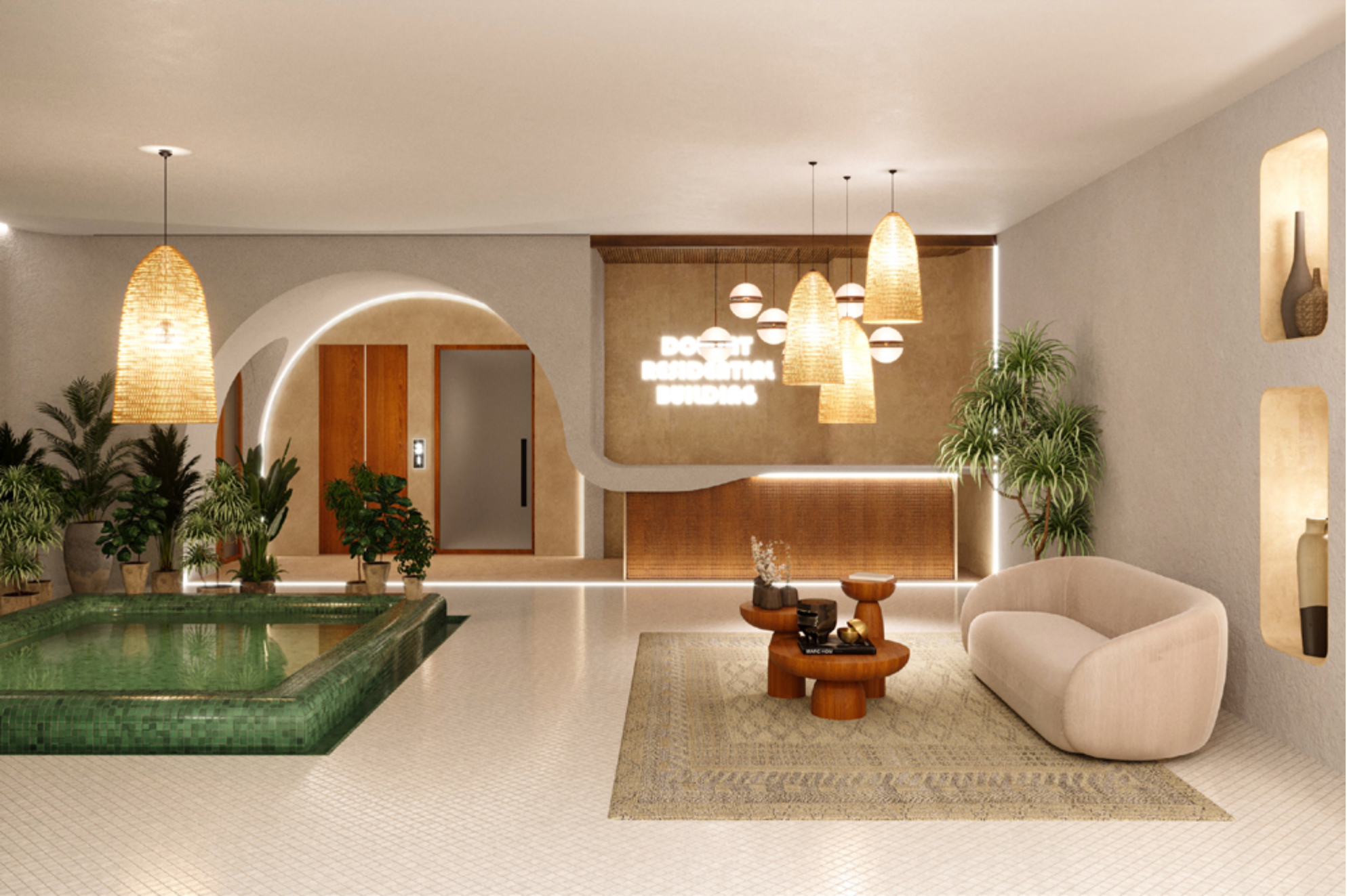
بخش شمال شرقی