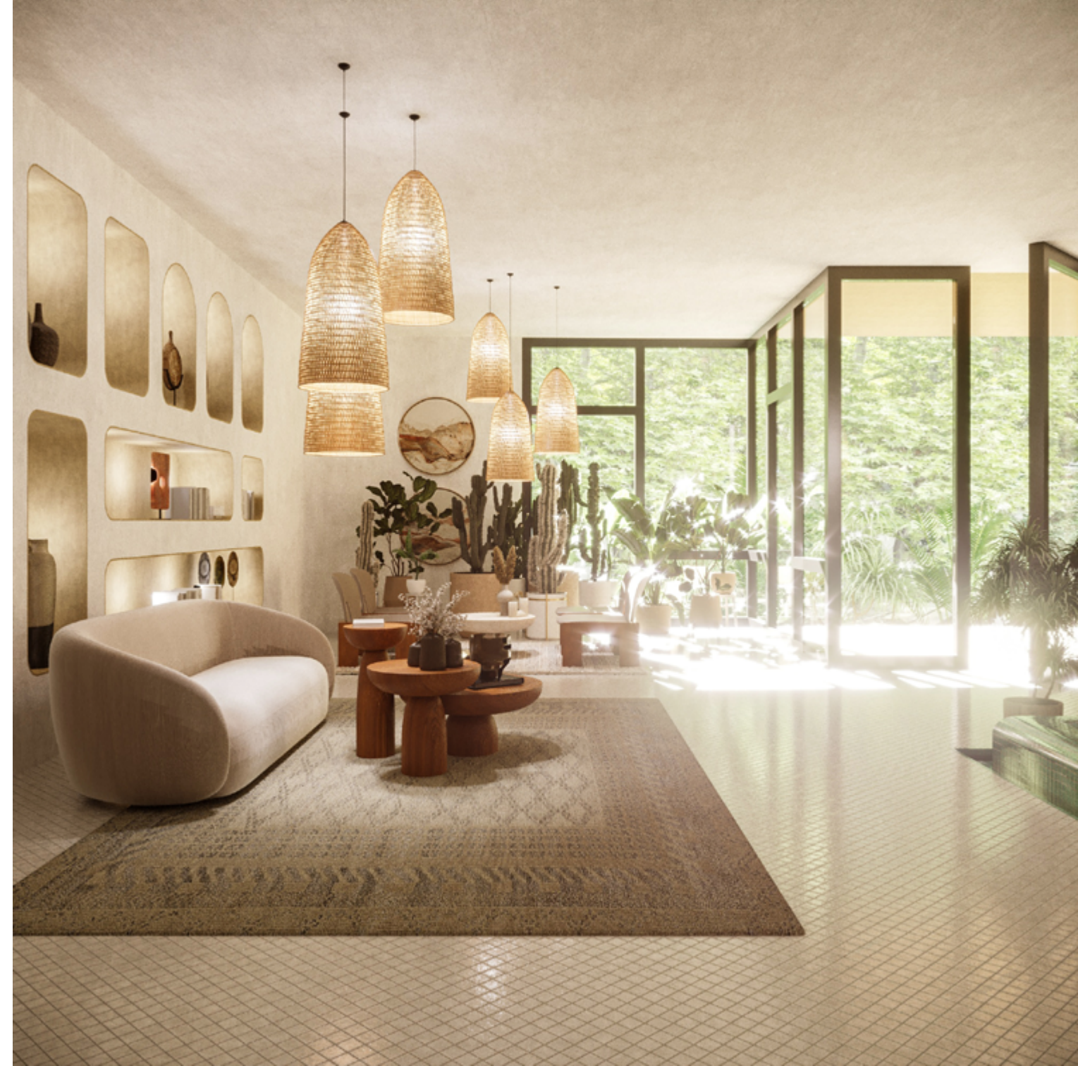
لابی و سالن انتظار