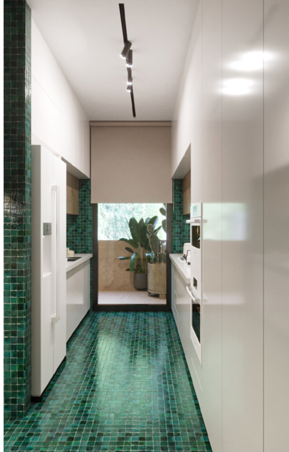
تصاویر سه بعدی طراحی داخلی اتاق خواب والدین واحد جنوبی