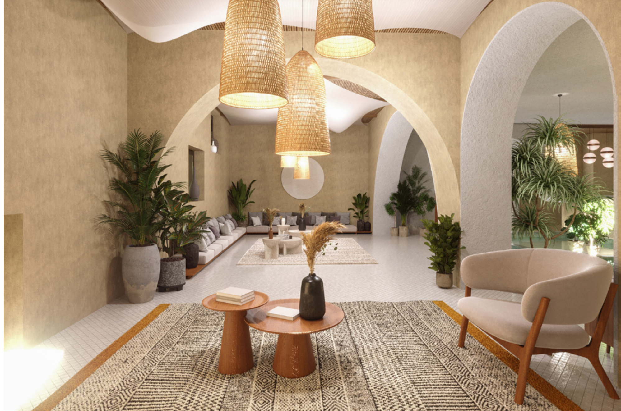
بخش شمال غربی