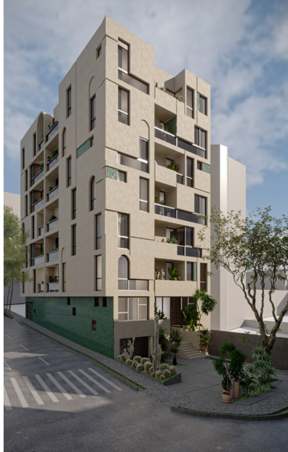
نمای جنوبی و غربی