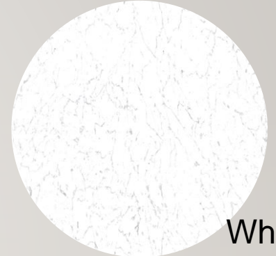
White marble stone