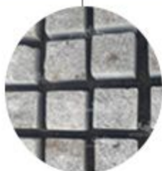
سنگ کوییک مشکی نطنز