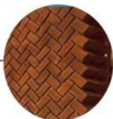
آجر قزاقی اخراپی رنگ