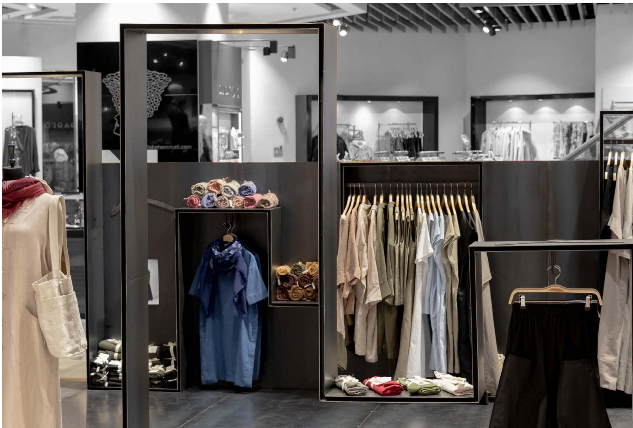
HITO STYLE TEHRAN, ROSHA DEPARTMENT STORE